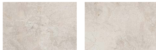
Naturale · Matt