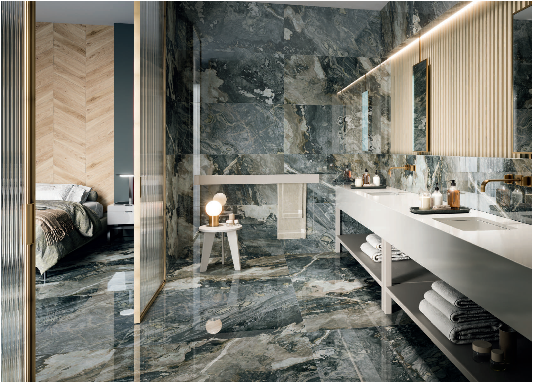
DEDALUS POLISH RECT. | 20X120 - 60X120